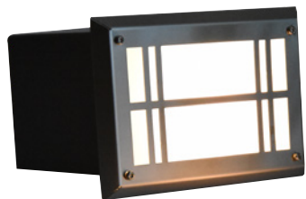
LUMV01RSTIO ruostumaton teräs ikkuna