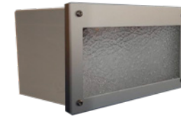
LUMV01_12V_ANODH ruostumaton teräs