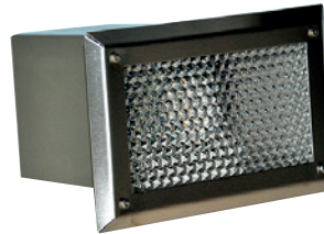
LUMV01RST ruostumaton teräs