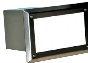
LUMV01RSTO ruostumaton teräs opaali