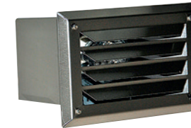
LUMV01RSTR ruostumaton teräs