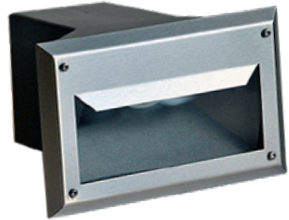
LUMV01RSTL ruostumaton teräs