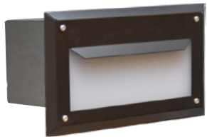
LUMV01MLO musta opaali