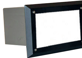
LUMV01MO musta opaali