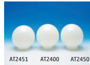
AT2451 AT2400 AT2450