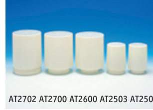
AT2702 AT2700 AT2600 AT2503 AT2500