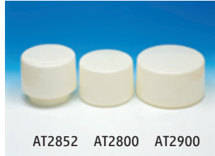
AT2852 AT2800 AT2900